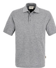
015 grau meliert